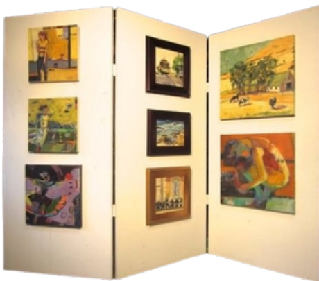
modèle en accordéon