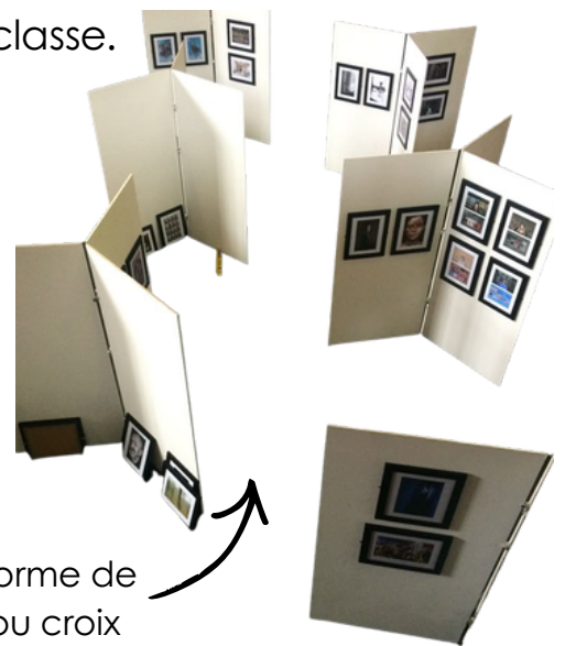
modèle en forme de panneaux ou croix