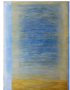
Fred-André Holzer, Summer space VI , 1977, aquarelle © ayant droits

Un certificat Covid est nécessaire pour entrer au musée