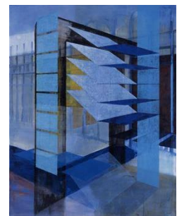
Jean-René Moeschler, Op. 1603 , 2008, acrylique et huile sur toile © l'artiste