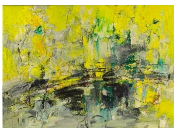
Jean-François Comment, Avant-printemps II , 1961, huile sur toile, © Ayant droits

Gratuité : pour tous les 1 ers dimanches d'ouverture d'une exposition ; membres du Club jurassien des Arts ; classes scolaires et enseignants ; enfants en âge de scolarité, étudiants en art ou histoire de l'art ; Passeport Musées Suisses ; membres AMS et ICOM, carte Raiffeisen.