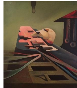
Gérard Bregnard, Un aviateur s'interroge , 1977, huile sur toile