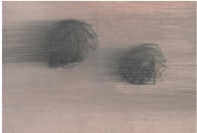
Mireille Henry, Sans titre , 2005 © l'artiste

L'exposition Entre femmes ! s'inscrit dans les présentations thématiques longue durée instaurées par le Musée jurassien des Arts depuis 2015. Puisés dans le riche patrimoine conservé au musée, les travaux sélectionnés ont été réalisés uniquement par des artistes femmes. Le dialogue entre les œuvres et le public y sera souligné, avec la création de carnets didactiques et de mallettes d'activités.