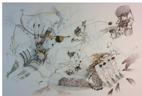
Romana del Negro, Zeichnung 7 [Dessin 7] , 2005 © l'artiste

Cette deuxième salle présente des thèmes que l'on aurait qualifiés autrefois de typiquement féminins : une vue de Hertenstein, un paysage enneigé, un chat, une toile d'araignée, des fragments de fleurs desséchées, une nature quelque peu mystique. Ces six travaux audacieux questionnent la perception du réel, tout en déstabilisant habilement et subtilement les repères du spectateur.