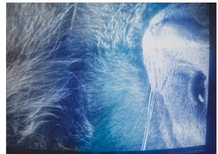
Daniela Keiser, Chatz I [Chat I] , 2006 © l'artiste

Les lieux d'apprentissage ont longtemps été interdits aux femmes, puis limités. N'ayant pas accès à l'étude de la nudité masculine, il leur était difficile de maîtriser l'anatomie et la morphologie, qualités essentielles pour maîtriser la peinture d'histoire – le genre qui permettait d'asseoir le talent et la renommée d'un artiste jusqu'au 19 e siècle. Ainsi les femmes ont été incitées à ne peindre que des sujets qualifiés de mineurs : des paysages ou des natures mortes, tous sujets délicats et plaisants. Ces circonstances ont engendré une classification à part de leurs travaux, désignés sous le terme d'art féminin .