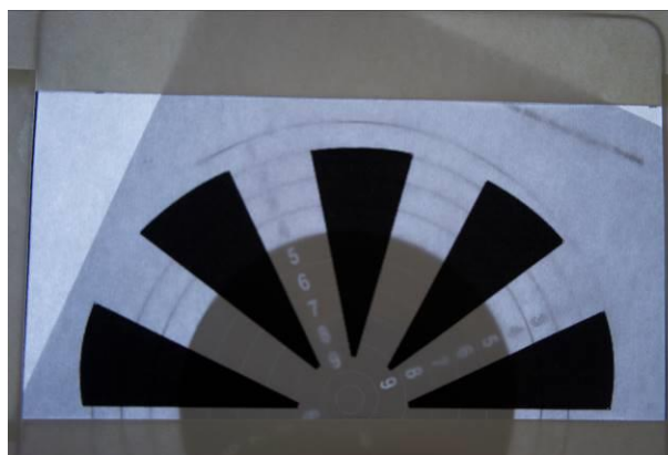
Jean-Daniel Berclaz, Ligne de visée , 2016 photomontage

Une installation dans l'exposition Point(s) de vue fait écho à ce Vernissage d'un Point de Vue . Cibles, table d'orientation, lunettes de tireur. Un étrange mariage qui tisse des liens entre la salle du Stand - ancien stand de tir - et le Musée. Jean-Daniel Berclaz associe ici paradoxalement deux points de vue divergents : celui du promeneur et celui du tireur. Il questionne ainsi la diversité des appréhensions du monde, selon les buts visés par l'être humain.