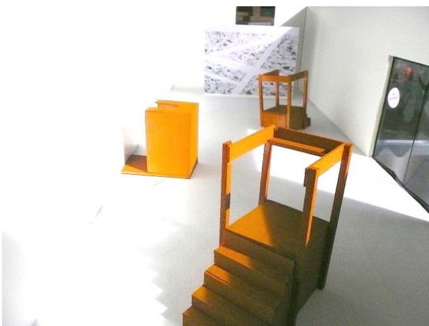
Rudy Schwyn, Installation pour l'exposition « Point(s) de vue », projet , 2016 Maquette

S'exprimant dans divers moyens d'expression, Ruedy Schwyn traite des modes d'apparition toujours changeants de la condition humaine et de ses relations au monde. Approfondir ses perceptions subjectives, trouver des correspondances entre ce qui attire ses sens – en particulier celui de la vision - et l'âme est au cœur de ses explorations. L'artiste parle donc fondamentalement du/des « point(s) de vue ».