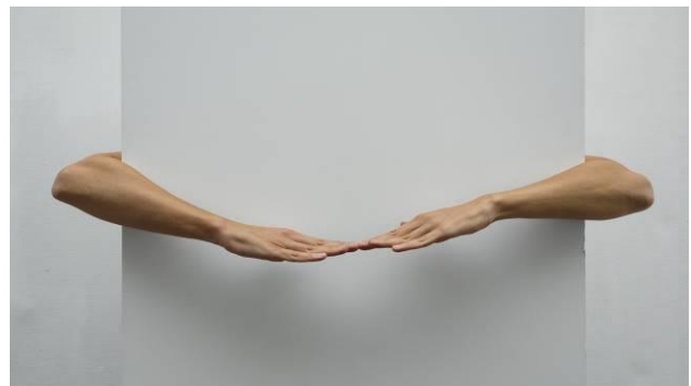
Judith Albert, Hinter dem Horizont (Derrière l'horizon) , 2013, vidéo HD, couleur, son mono, 10' loop, © l'artiste

L'exposition Point(s) de vue questionne ainsi notre position en tant que spectateur. Présentée en parallèle, l'exposition Horizon(s) : au fil des collections offre un dialogue passionnant avec ces interventions contemporaines. Point de vue et horizon : deux acteurs étroitement liés dans les univers de l'art et de la perception visuelle.