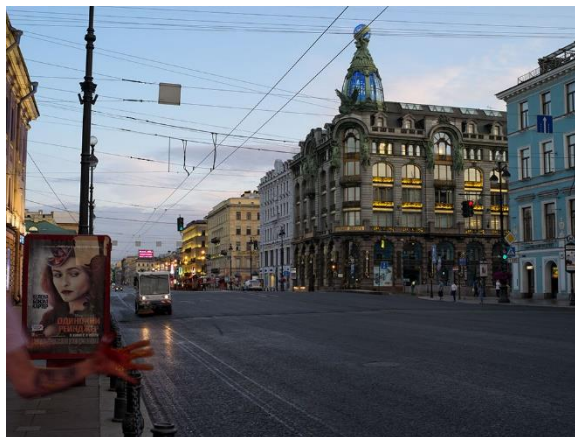
De la série Le Crépuscule de l'aube , Saint-Pétersbourg, perspective Nevski , 2013, photographie, 112 x 150 cm

Mais plus loin, il interroge notre rapport à la photographie, la confusion répandue entre image et réalité. Or l'écart entre le réel et sa saisie photographique est souvent essentiel, qu'il se situe dans l'usage qu'on fait d'une image – la même peut être utilisée avec des légendes opposées – ou dans la manipulation qu'elle peut subir. Même une simple photographie de vacances cadre et immortalise un instant fugitif vécu et définitivement passé. Avec Le Crépuscule de l'aube , Gérard Lüthi propose « une fiction qui se prétend véritable » 2 au sens où l'entend Joan Fontcuberta, pour suggérer, tout en nuances, que la photographie peut être proche du mensonge.