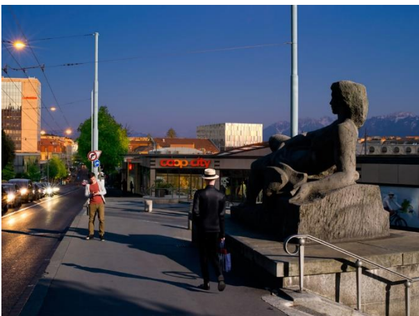
De la série Le Crépuscule de l'aube , Lausanne, avenue du théâtre, 2014, photographie, 112 x 150 cm

Interroger le regard du spectateur et affirmer la subjectivité du photographe, c'est ce que Gérard Lüthi poursuit dans sa démarche depuis de nombreuses années. Parmi ses séries précédentes, Recto verso (2009-2011) et Le Sens des choses (2008-2011) relativisaient à la fois notre perception du monde et ses reflets photographiques. Composée d'une vingtaine d'images de grand format, Le Crépuscule de l'aube poursuit ces questionnements avec de nouveaux accents sur la lumière et la mise en scène.