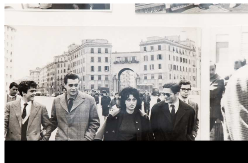
Twisted Realism , vidéo, still