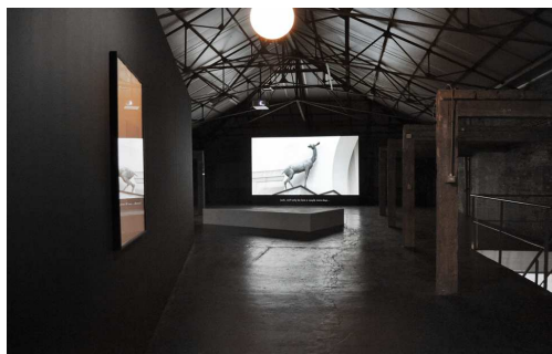
Twisted Realism , vidéo, exposition à Argos, Bruxelles, 2012

Le mode de présentation de ces films qui se complètent est évolutif, conçu comme un work in progress qui connaît à chaque fois de nouveaux dispositifs. Twisted Realism a déjà été projeté dans des versions antérieures ou dans des configurations différentes à La Rada, Locarno (2010), à la Biennale de Venise (2011, dans le cadre de Chewing the Scenery ) et à Argos, Bruxelles (2012). Mais son installation au Musée jurassien des Arts prend des formes inédites de mises en espace, avec de nouvelles constellations d'oeuvres, d'objets, de livres, de disques. Elle intègre également le portrait filmé, Pier Paolo Pasolini: Cultura e società , réalisé en 1968 par Carlo Di Carlo (un des protagonistes de Twisted Realism , qui fut l'assistant de Pasolini sur le tournage de Mamma Roma ) et un choix d'oeuvres de la collection du Musée. Ces différents éléments approfondissent ou élargissent plusieurs thèmes présents dans Twisted Realism .