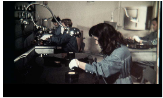
Twisted Realism , vidéo, still

Cette vidéo, montée comme un collage, prend le film Mamma Roma (1962) de Pier Paolo Pasolini comme point de départ pour interroger la période du « miracle économique » en Italie. Une polyphonie de voix raconte le scénario du film. Certains lieux de tournage de Mamma Roma sont revisités et incarnent une nouvelle géographie de la Rome contemporaine. La vidéo interroge des « esthétiques de la réalité » variées dans les représentations cinématographiques du développement urbain du quartier INA-Casa Tuscolano - un projet social de logement à large échelle construit dans les années 1950-60. Elle déconstruit les logiques de propagande de documentaires filmés, gouvernementaux. Twisted Realism traite ainsi non seulement du problème social du logement et de la migration dans l'Italie des années 1950-60, mais aussi du médium cinématographique.