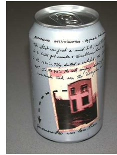
Panamarenko Art Can